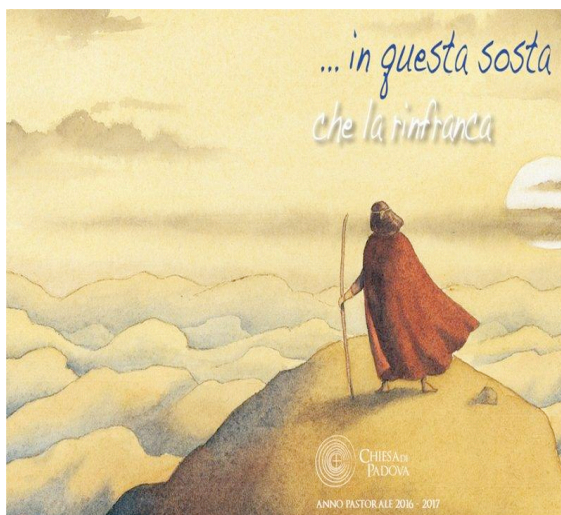
Anno Pastorale 2016 - 17